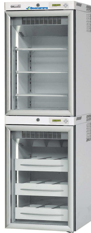
** Abbildung zeigt Gerät CEMT26_W mit Optionen

Das Boomerang Monitoring System wurde entwickelt, um die Qualitätssicherung zu vereinfachen, wobei alle verschiedenen Arten von Parametern wie z.B. die Temperatur automatisch aufgezeichnet und überwacht werden. Die Boomerang Medikamentenkühlschränke sind für das Boomerang Monitoring System vorbereitet.