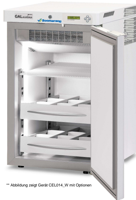
** Abbildung zeigt Gerät CEL014_W mit Optionen

Die Boomerang Medikamentenkühlschränke sind für das Boomerang Monitoring System vorbereitet.